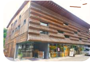
マルシェ・ユスハラ