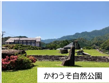
かわうそ自然公園