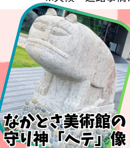
なかとさ美術館の 守り神「ヘテ」像