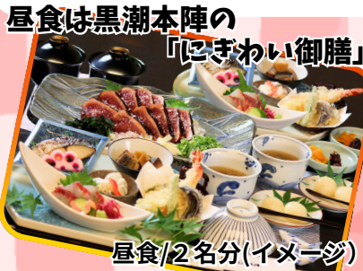
昼食/2名分(イメージ)