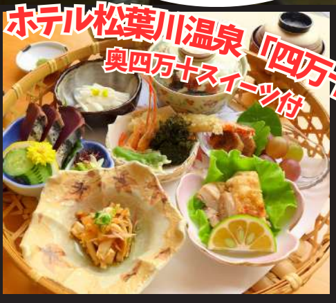
ホテル松葉川温泉 奥四万十スイーツ付 「四万十御膳」